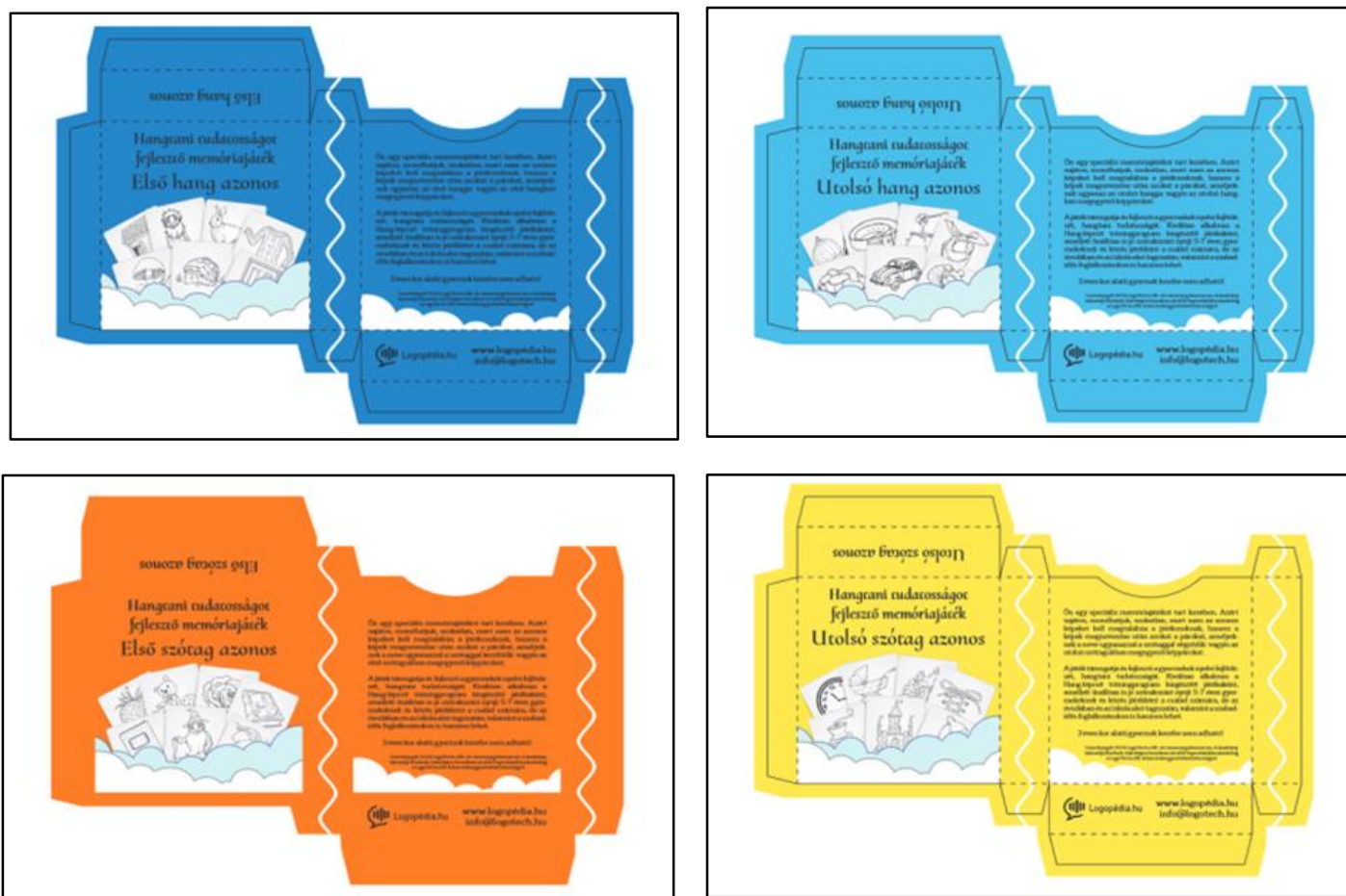
1. kép Memóriakártyák

A kártyajátékok kiváló kiegészítői a Hang-lépcső és a Hang-lépcső 2. című tréningprogramnak, de önálló játékként is jó szórakozást jelentenek, élményszerűen, játékosan támogatják a nyelvi fejlődést. A gyermekek számára ismeretlen szavak elmagyarázásával pedig a szókincs bővíthető. Szükség esetén a játék felfelé fordított/látható képekkel is játszható, ilyenkor mindvégig látják a gyermekek a képeket, így keresik a párokat. A játékot akár egy játékos is játszhatja, ebben az esetben csak ő forgatja a kártyákat. Minden kártyacsomag 50 db memóriakártyát (25 párt) tartalmaz. Egy-egy játék során nem feltétlenül kell az összes kártyát használni, ezáltal elkerülhető, hogy a gyermekek megjegyzzék, megtanulják az egyes párokat. A kártyák szóanyagát megfelelően állították össze, a rajzok felimerhetők, változatos módon lehet használni a játékot a foglalkozásokon, örömmé teszik a fonológiai (hangtani) tudatosság fejlesztését.