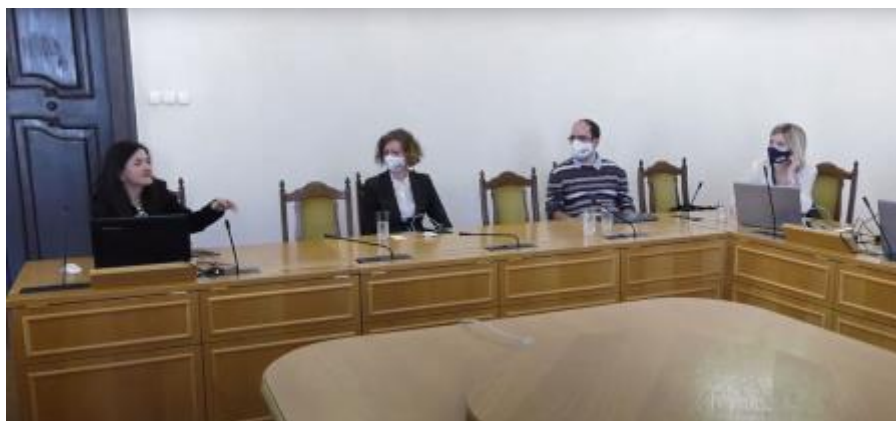
3. kép A konferencia első kerekasztal-beszélgetése

Problémafelvetésében megfogalmazta, hogy az anyanyelvi nevelés hatékonyságához a tanulói nyelvi tapasztalatokból kiinduló szemléletre és gyakorlatokra lenne szükség, amely a nyelvi tevékenységet rugalmasan értelmezi, valamint a nyelv társas és kognitív vonatkozásaira is kellő hangsúlyt fektet. A kerekasztal résztvevői, a PeLi Oktatásnyelvészeti Kutatócsoport tagjai hozzászólásukban az elméleti vonatkozások mellett konkrét példákkal szemléltetve mutattak be olyan módszertani lehetőségeket, amelyek révén a valós életből vett nyelvi problémák, adatok értelmezése indítja el a tanulás folyamatát.