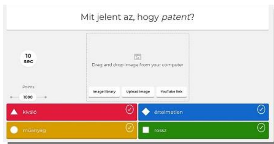
6. kép Részlet a szlenges Kahoot! kvízből

Az alábbi saját Kahoot! kvíz segítségével lehet olyan pedagógusoknak, akik még nem próbálták ki ezt a programot (2).