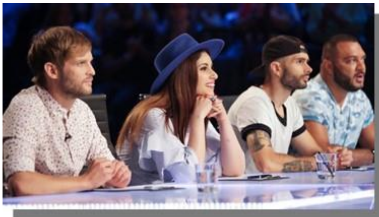
5. kép Szlengelő celebek 3.: X-faktor