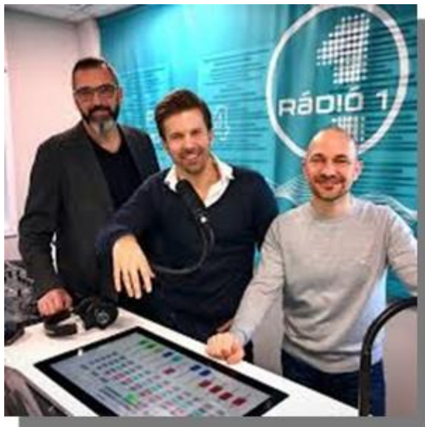
3. kép Szlengelő celebek 1.: Morning show