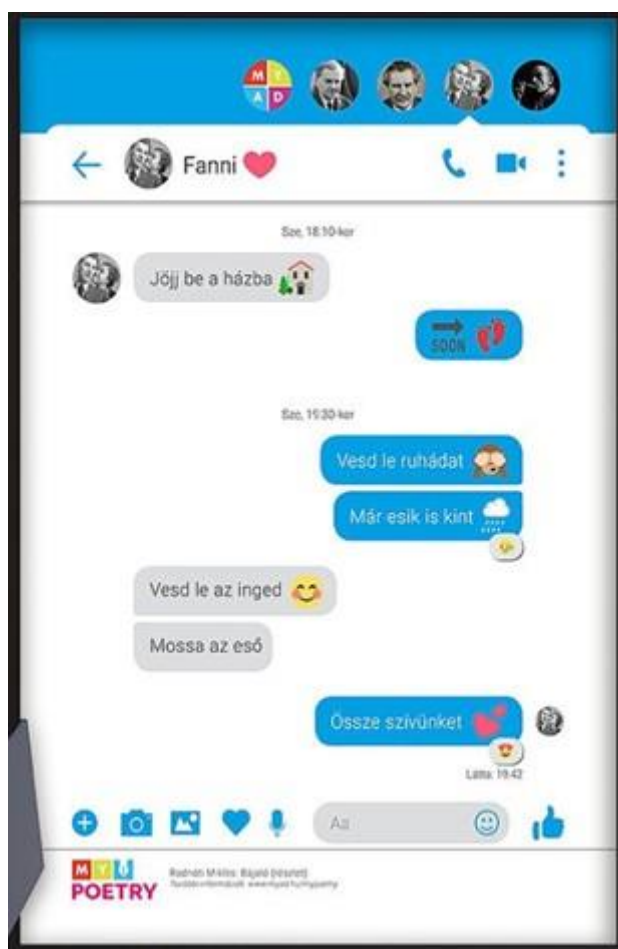
7. kép Radnóti a Messengeren

A levelek átírása, felolvasása/kivetítése után könnyen megállapítható az internetes nyelv, a digilektus (Veszelszki 2012) jellemzőinek a mibenléte. Amellett, hogy a szleng várhatóan hangsúlyosan meg fog jelenni az üzenetekben, minden bizonnyal számos rövidítés, emoji, idegen nyelvű kifejezés is található lesz bennük, amelyek a netnyelv sajátjai (Crystal 2001). Arany és Petőfi levelei éles kontrasztban állnak a ma Messengeren használt levelezési formával mind szerkezetileg, mind stílárisan. E különbségek a feladat során szembeűnővé válhatnak a diákok számára, ezáltal tudatosítva saját mindennapi internetes kommunikációjuknak a jellemzőit.