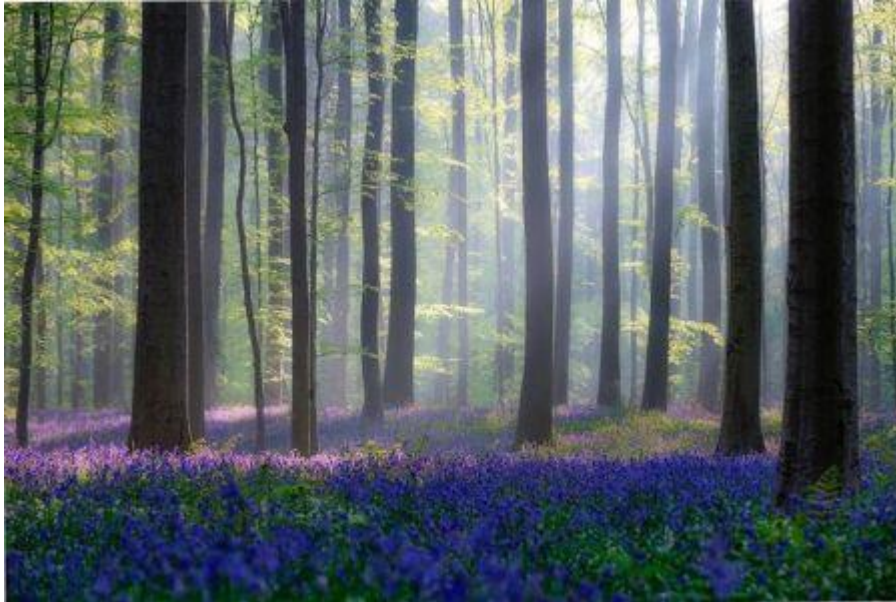
2. ábra Angyalok Tisztása (2)

Az írásbeli kifejezőkészséget és a képzelőerőt fejleszti az Angyalok Tisztásához kapcsolódó feladat. Talán a legtisztább, legcsendesebb része ez a gyűjteménynek. Az órán Mozart Andante című művét hallgatva és az alábbi képet nézve csendesítjük el a gondolatainkat, és fogalmazhatjuk meg az érzéseinket az asszociációk hatására. A kép és a zene kapcsolata motiválja a diákokat a leíró formában elkészítendő szövegre. A tanulóknak 8–10 mondatban azt kell megfogalmazniuk, hogy mit érezhet az ember ezen a tisztáson.