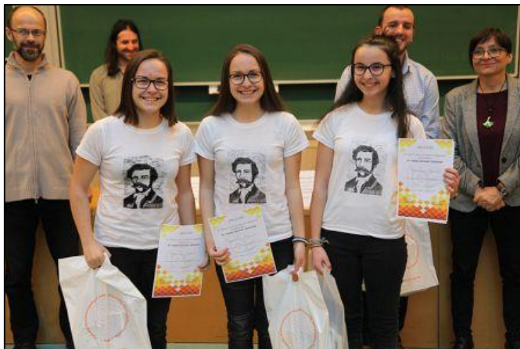
3. kép A Legere egyik győztes csapata